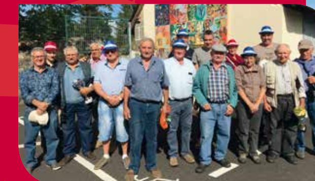
Concours de fauche : les hommes de l'art avant et après l'épreuve.

La fête patronale de la Saint Sixte s'est tenue le 12 et 13 août 2017 sous le soleil.