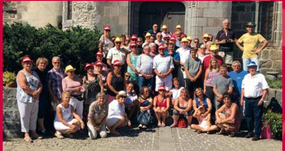
Et le groupe au complet, devant l'église.

C'est une habitude, ce programme a été ponctué de moments conviviaux dont la soirée festive du samedi soir. Merci à l'équipe de bénévoles pour l'organisation de ce week-end et rendez-vous en 2019 en Normandie.