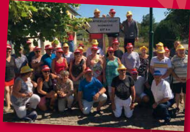
Juste après la pose, autour du panneau indiquant la distance qui nous sépare de nos amis normands.

Le musée de la mine et le musée de l'école de Messeix, la visite du château de Parentignat et la découverte de la Vallée des Saints à Boudes ont été très appréciés par nos invités.